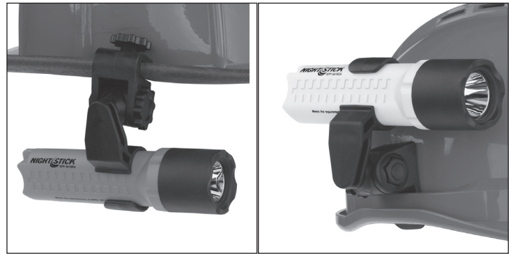
XPP-5418 with Brim Mount